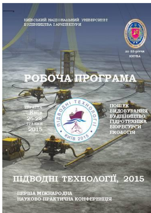
Рис. 1. Запрошення й робоча програма конференції Fig. 1. Invitation and executable code of conference