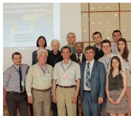
Фото на згадку