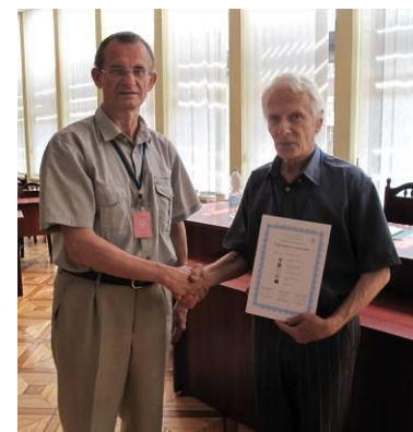
Вручення Сертифікатів учасникам МНПК