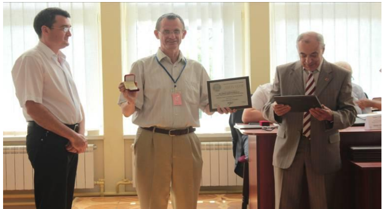
Велика срібна медаль Академії будівництва України