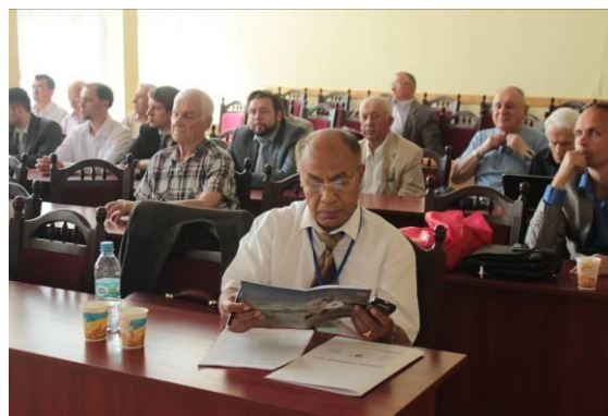
Рис. 2. Відкриття Першої Міжнародної науково-практичної конференції «Підводні технології, 2015» Fig. 2. Opening of the First International scientifically-practical conference is «Underwater Technologies, 2015»

5. Розробка та відновлення морських біо-ресурсів: