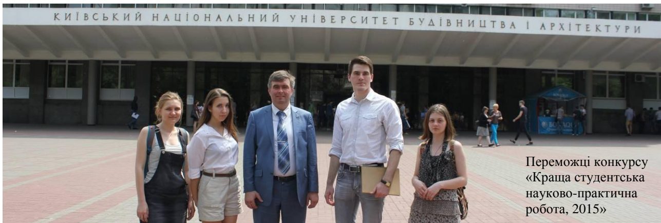
Переможці конкурсу «Краща студентська науково-практична робота, 2015»