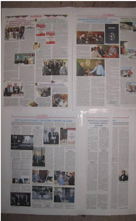
Міжнародні стосунки науковців