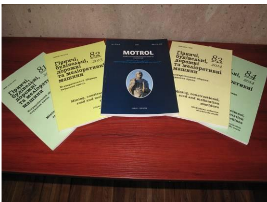
Спільні фахові видання